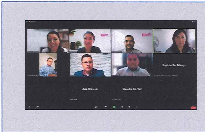
Sesión Extraordinaria Urgente 26 de julio de 2023