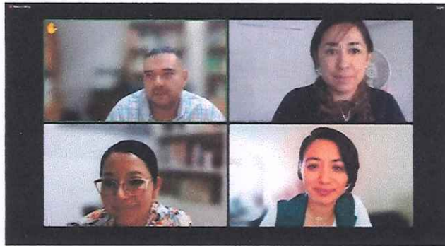
Sesión Ordinaria 20 de Julio de 2023